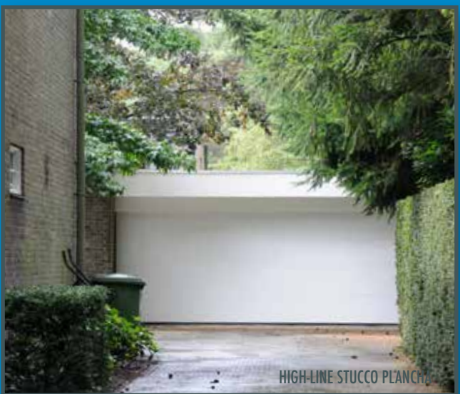
HIGH-LINE STUCCO PLANCHA

Ein High-Line Stucco-Garagentor ist eine schöne und vernünftige Investition.